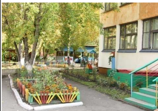
Детский сад в летний период

В группах оборудованы информационные стены – магнитные доски, где дети могут размещать материалы к тематическим неделям, которые будут востребованы в образовательной работе: иллюстрации, картины, схемы, памятки.