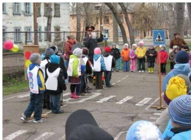
Площадка для изучения ПДД