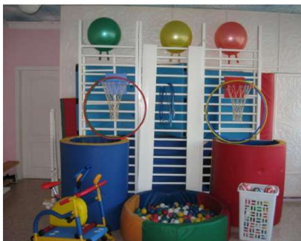
Спортивный и музыкальный зал