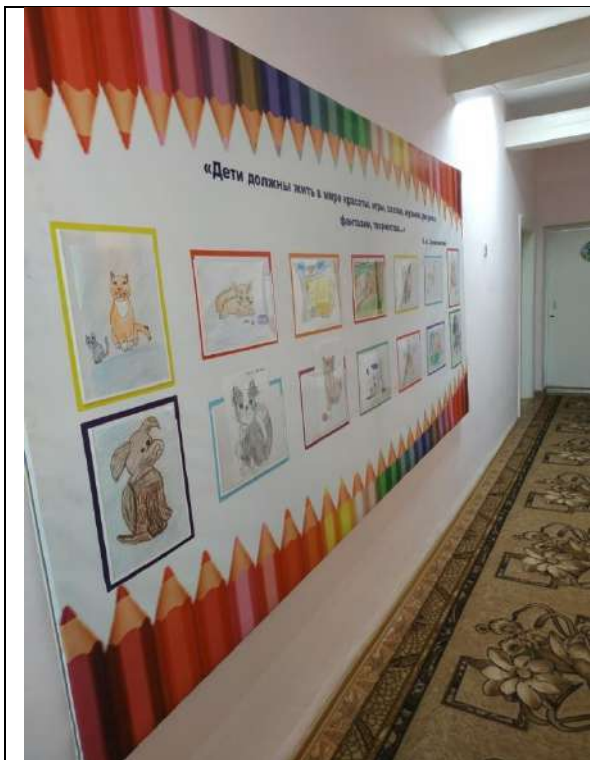
Оформление лестничных пролетов работами детей